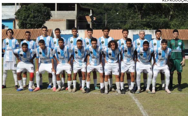
TIME jovem da LAD venceu os dois confrontos regionais

Mas a equipe de Angra partiu para cima do time de Mangaratiba desde o co-